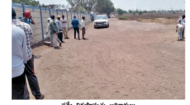
సర్వే నిర్వహిస్తున్న అధికారులు