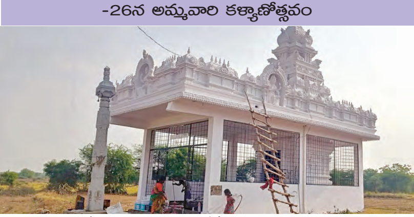
వార్షికోత్సవాలకు ముస్తాబుతున్న శ్రీరేణుక ఎల్లమ్మ ఆలయం దృశ్యం

చౌటూరు, ఏప్రిల్ 23, ప్రభాతవార్త: మండల కేంద్రమైన చౌటూరులో కొలువుదీరిన భక్తులచే నిత్యం పూజలందుకుంటున్న శ్రీరేణుక ఎల్లమ్మ ఆలయ 4వ వార్షికోత్సవాలను ఈ నెల 25, 26వ తేదీలలో ఘనంగా నిర్వహించేందుకు నిర్వాహకులు, గౌడ సంఘం బాధ్యులు తగు ఏర్పాట్లు పూర్తిచేశారు. 24న గోపూజ, గణ పతిపూజ, ఆవాహిత దేవతపూజ, లక్ష్మీగణపతి హవనము, అమ్మవారి గంగాస్నానాన్ని తదితర పూజా కార్యక్రమాలు నిర్వహించారు. 26న శ్రీరేణుక ఎల్లమ్మ జమదగ్ని కళ్యాణముహూర్తం, సాయంత్రం భజనాలు, ఆలయానికి చేరుకున్న భక్తులకు ప్రసాదవితరణ కార్యక్రమాలు నిర్వహించారు. ఆలయ వార్షికోత్సవాలకు గ్రామ స్థూలతో పాటు పరిసర గ్రామాల నుంచి భక్తులు, అతిథులతో వెళ్లిన గ్రామ ఆదవలను తమ కుటుంబ సభ్యులతో గ్రామానికి చేరుకుని వార్షికోత్సవాలలో పాల్గొని అమ్మవారి పూజా కార్యక్రమాలు నిర్వహించి తమ మొక్కుబడులు కానున్నారు. వార్షికోత్సవాల సందర్భంగా ఆలయ చెల్లింపుకుని అమ్మవారి కృపకు పాత్రులు పరిసరాల నుండిగా మారనున్నారు.