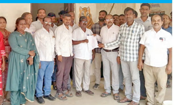
తహసీల్దార్ కి మెమోరాండం ఇస్తున్న దృశ్యం