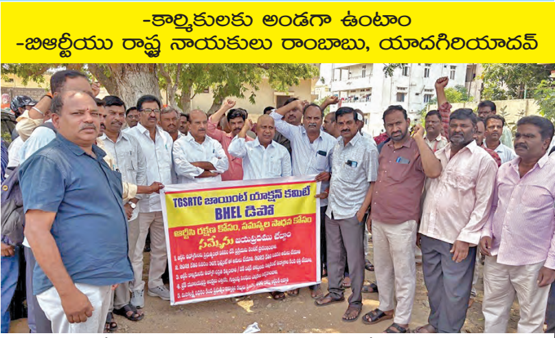
ఆర్ట్స్ కార్మికుల సమ్మెకు మద్దతు ప్రకటిస్తున్న బిఆర్ఎస్ నాయకులు